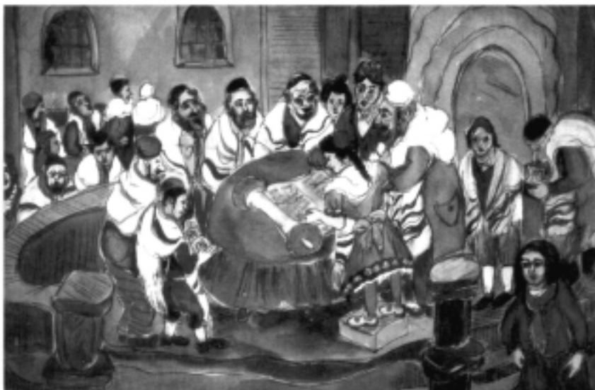
בת מצוה, גלוית ברכה, ארה"ב

להדגמת כובד עניינו של מושג 'כבוד הבריות', נביא קטע מתשובתו של ר' אליעזר ולדינברג 14